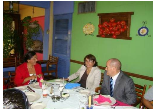
Delegación Salvadoreña intercambiando experiencias con funcionarios de la OTSSPA y Autoridades Judiciales de Managua. 27.08.2010