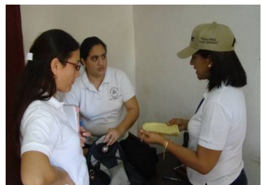
Funcionarias de la OTSSPA revisando fichas en Oficina de Control Penal del SPR/ Granada.