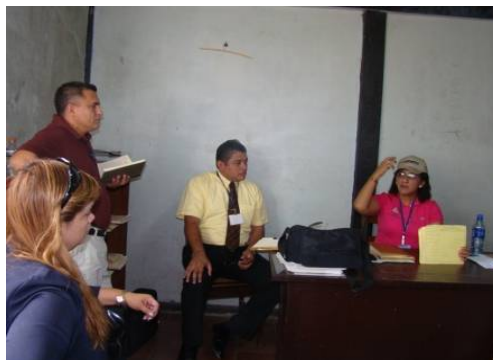
Funcionarios de OTSSPA/CSJ y JPDA Jinotega y Matagalpa.